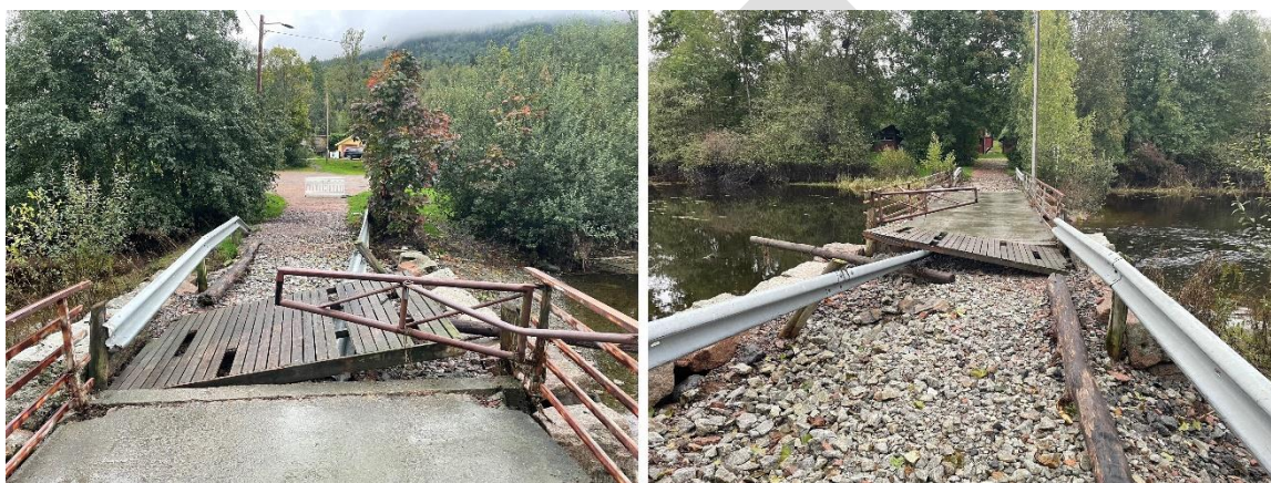
Broa til Søfastøya ble delvis ødelagt av flom forårsaket av stormen Hans.

Berger båtforening ønsker å bygge en småbåthavn i Blindsand selv om Konsekvensutredningen konkluderer med at en utbygging på Blindsandodden eller ved Bergerbukta båthavn ikke er forsvarlig fordi det blant annet vil føre til for store inngrep i viktig marin natur. Drammen kommune inviterte likevel til høring om bygging av småbåthavn fortrinnsvis i Blindsand, deretter Bergerbukta båthavn, mens båtforeningen ikke ønsker båt plass ved Berger brygge. VMU leverte høringsvar den 20. mai.