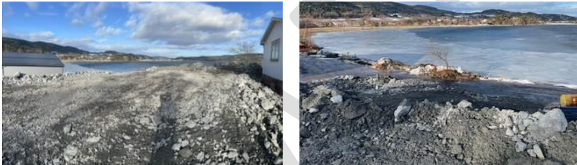
Fyllinger på Bokerøya.