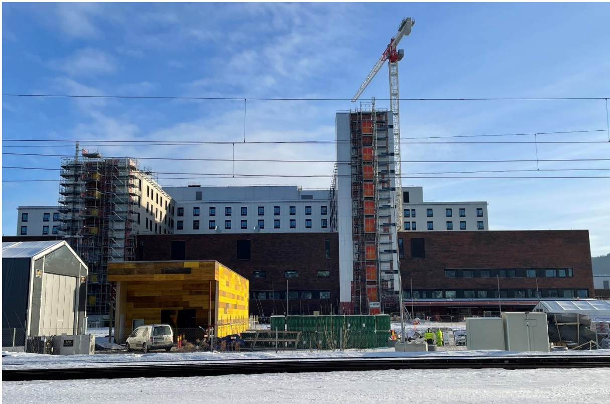
Nytt sykehus under bygging.