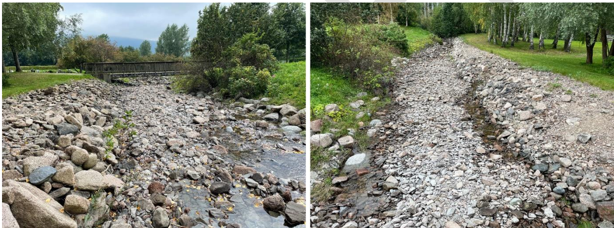
Kjøsterudbekken etter flom forårsaket av stormen Hans.