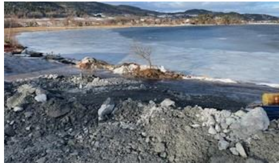
Fyllinger på Bokerøya.

Vi er bekymret for at utfyllingene på Bokerøya er et første (ulovlig) skritt i retning av å komme i gang med storstilt utbygging av småbåthavn til 1000 båtplasser ved Knemstranda i Homannsbergbukta utenfor Svelvik. Det er store forekomster av ålegras i Homannsbergbukta. Ålegrasene her er helt avgjørende som oppvekst- og leveområder særlig for småfisk, men også for større fisk og fugl. En stor småbåthavn med trafikk og forurensning vil kunne ødelegge for alt liv over og under vann i området.